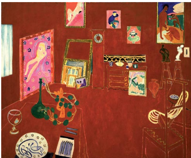
Henri Matisse L'atelier rouge, 1911

Dez anos de solidão, 1983 Óleo sobre tela, 160 x 180 cm Coleção João Sattamini, Comodante Museu de Arte Contemporânea de Niterói, RJ