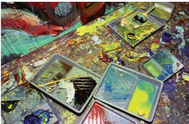
Material de pintura no ateliê de Jorge Guinle.

Adão e Eva, 1987 Óleo sobre tela, 200 x 140 cm Coleção Ricard Akagawa, São Paulo