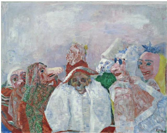
James Ensor Masques devant la mort, 1888

A grande festa, 1986 Óleo sobre tela, 150 x 260 cm Coleção Hildegard Angel, Rio de Janeiro