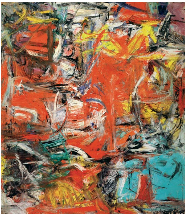
Willem de Kooning Composition, 1955

Summer interlude, 1986 Óleo sobre tela, 155 x 275 cm Coleção Eduardo Guinle, Rio de Janeiro