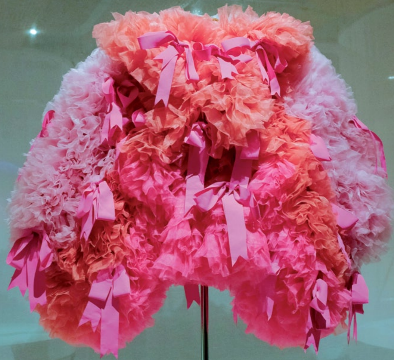
Vestido com mangas longas, coleção primavera/verão 2020 Organza e cetim