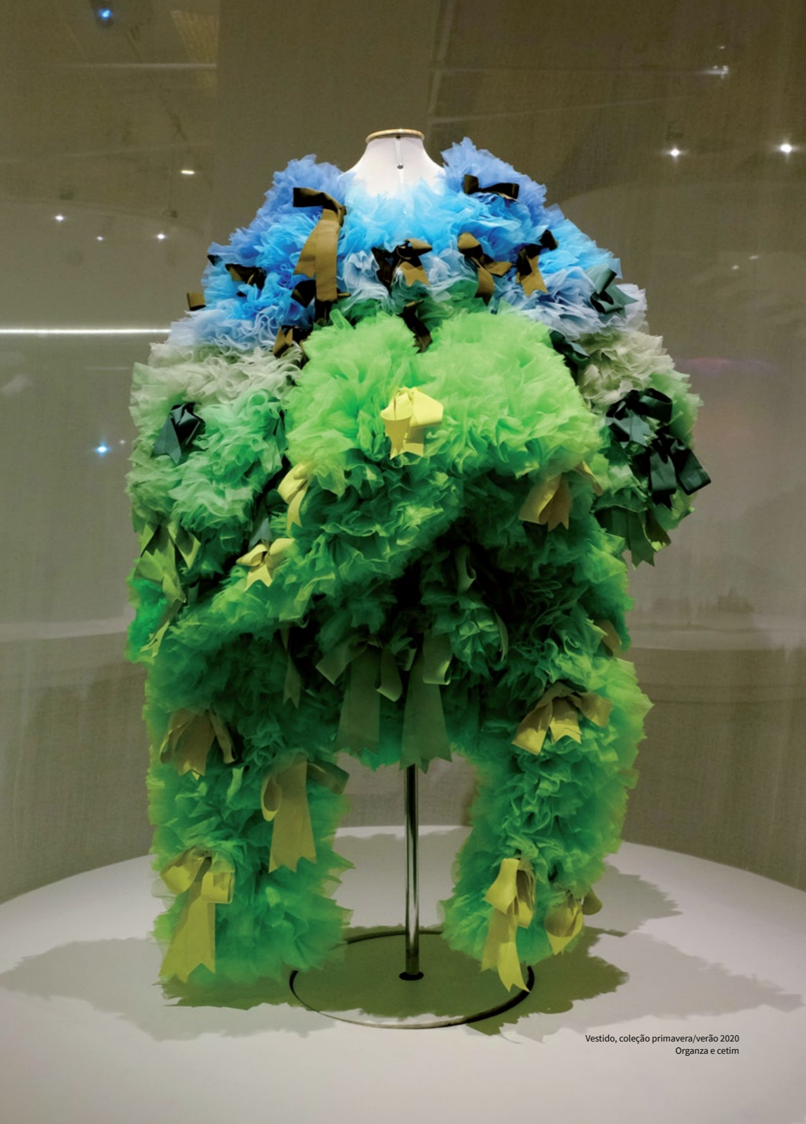
Vestido, coleção primavera/verão 2020 Organza e cetim