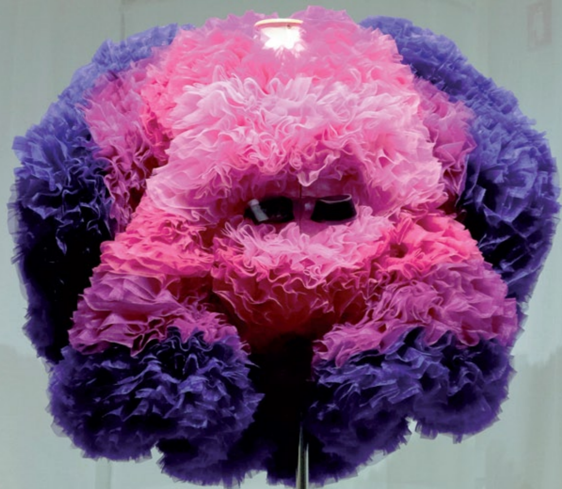
Collant, coleção Japan House 2020 Organza e cetim