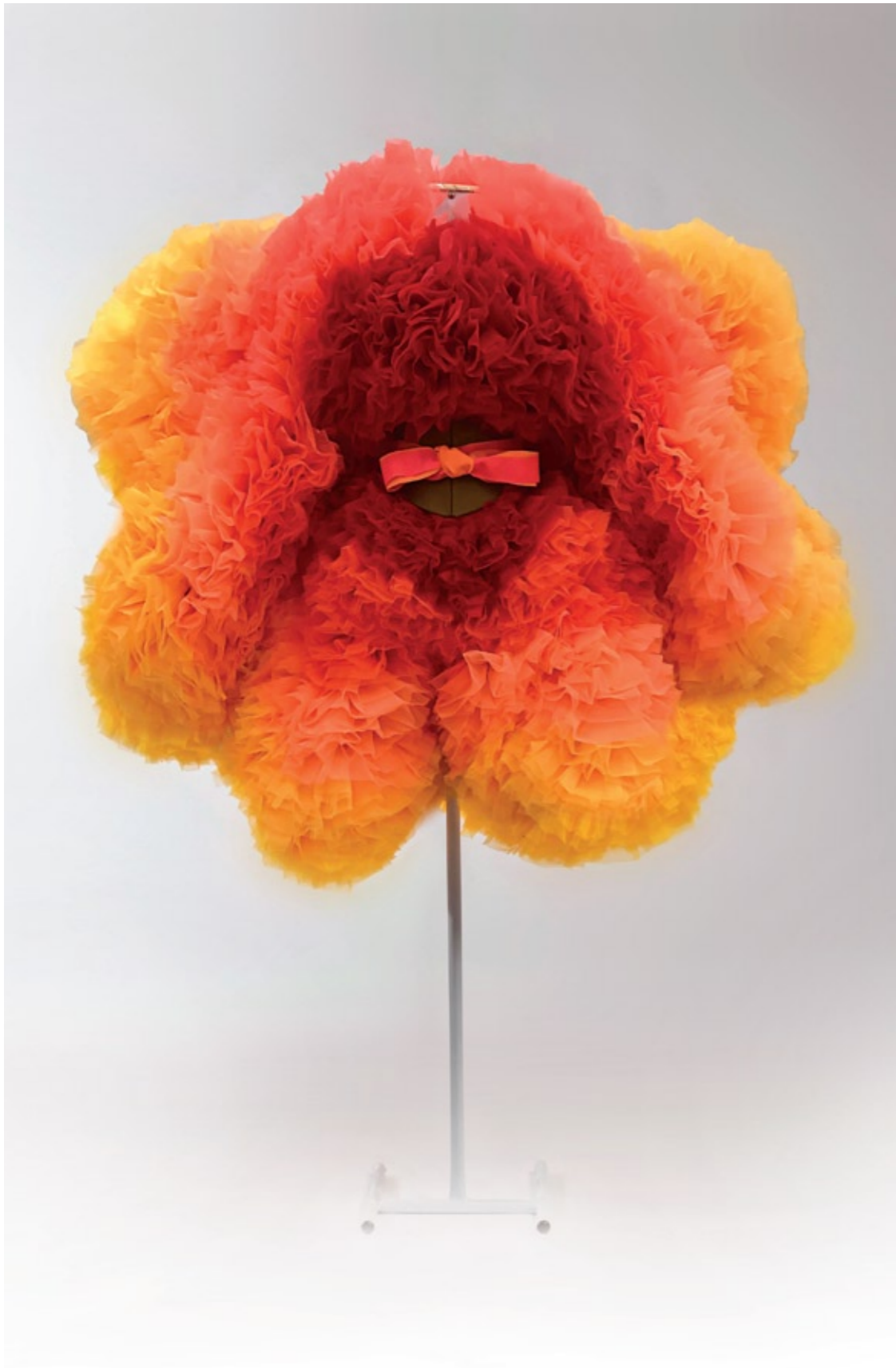
Collant, coleção Japan House 2020 Organza e cetim