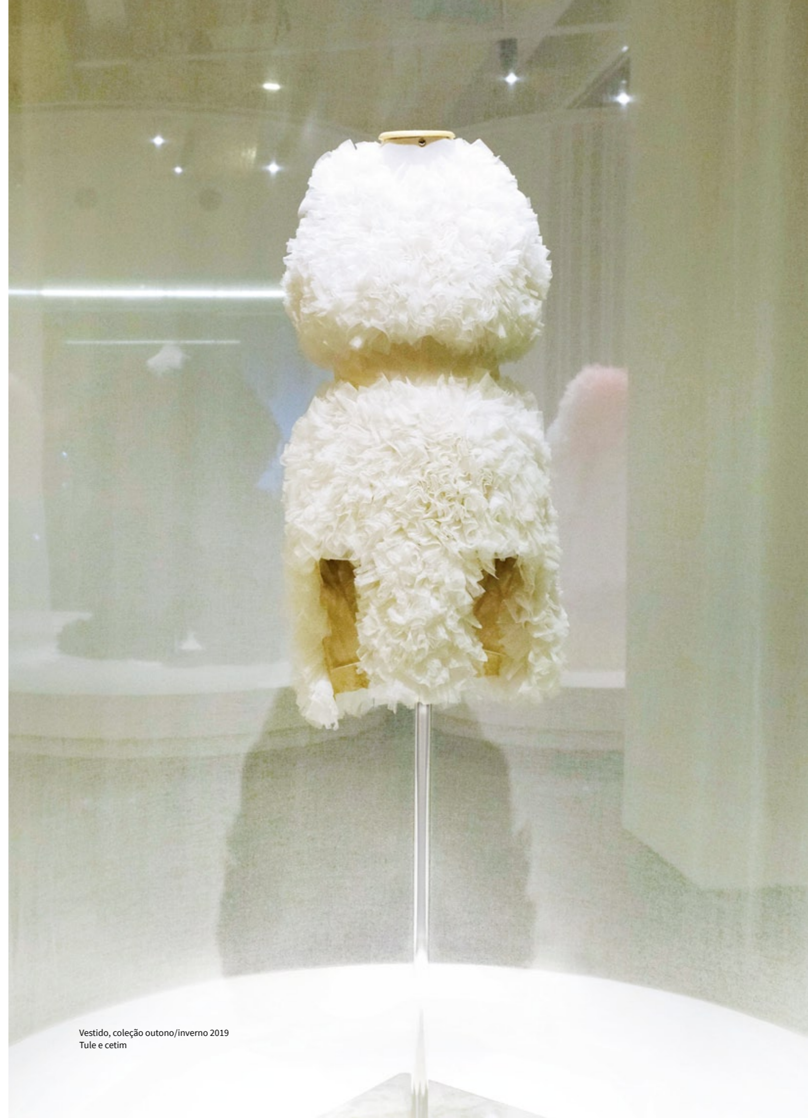
Vestido, coleção outono/inverno 2019 Tule e cetim