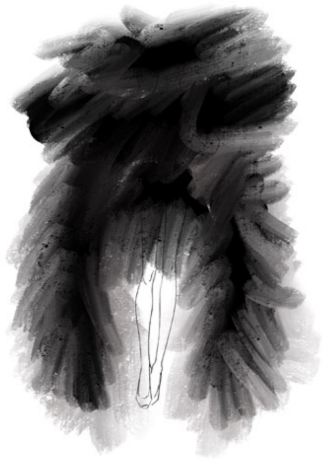
Vestido kimono, coleção primavera/verão 2020 Organza e cetim