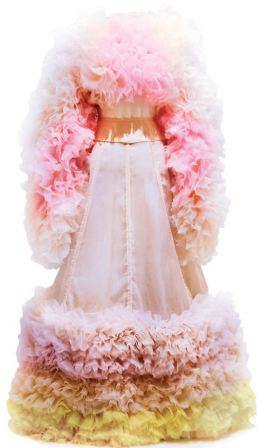
Jaqueta e saia longa, coleção outono/inverno 2019 Organza e cetim