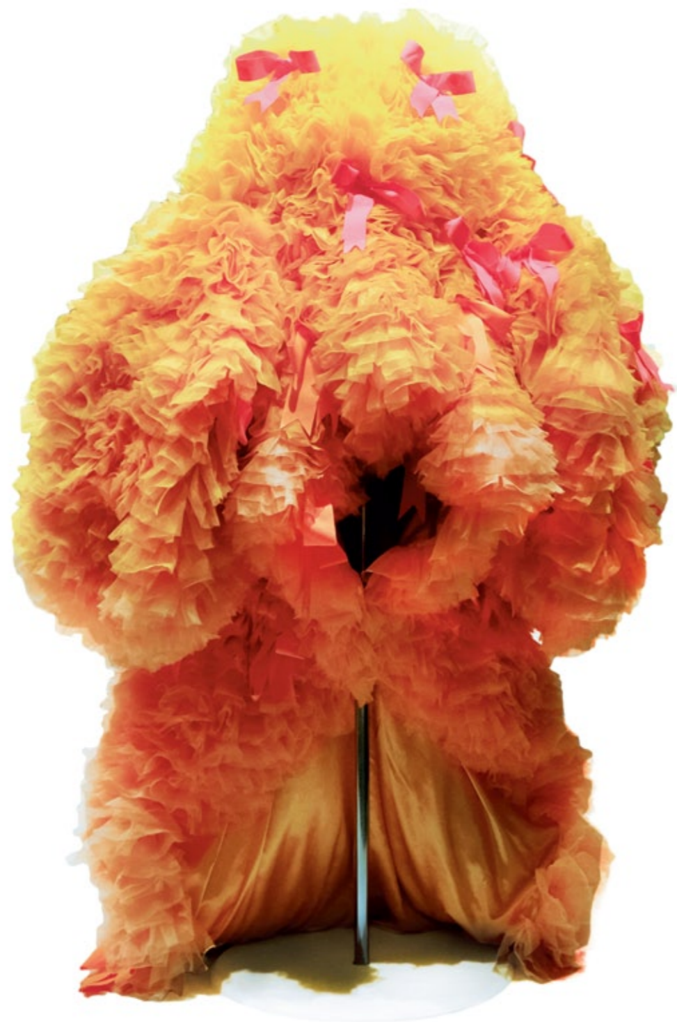
Vestido de cauda, coleção primavera/verão 2020 Organza e cetim