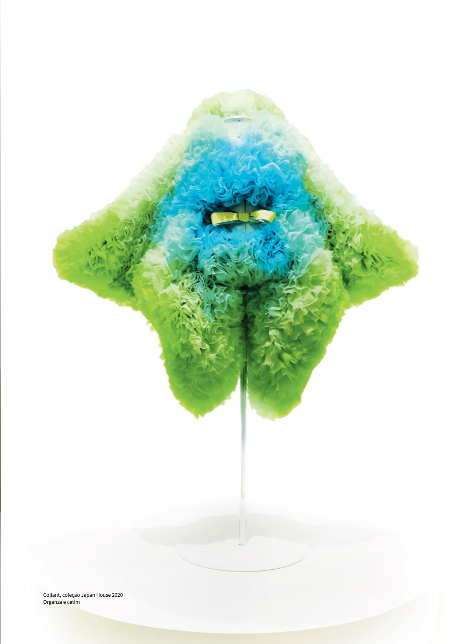
Collant, coleção Japan House 2020 Organza e cetim