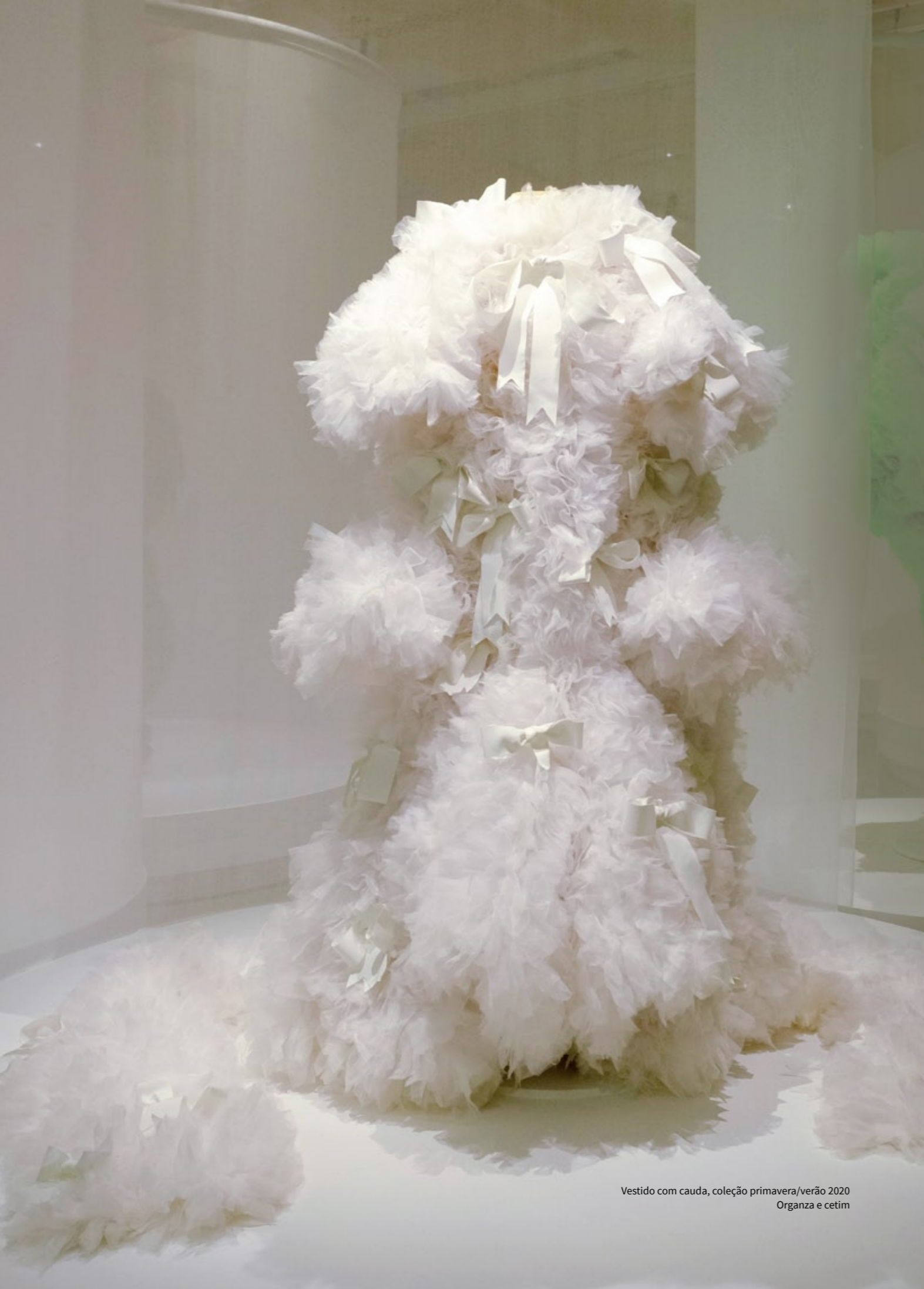
Vestido com cauda, coleção primavera/verão 2020 Organza e cetim