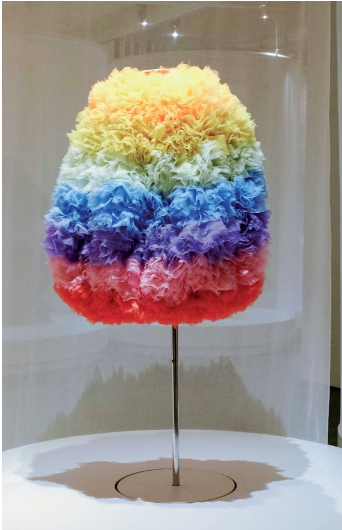
Capa, coleção outono/inverno 2019 Organza e cetim