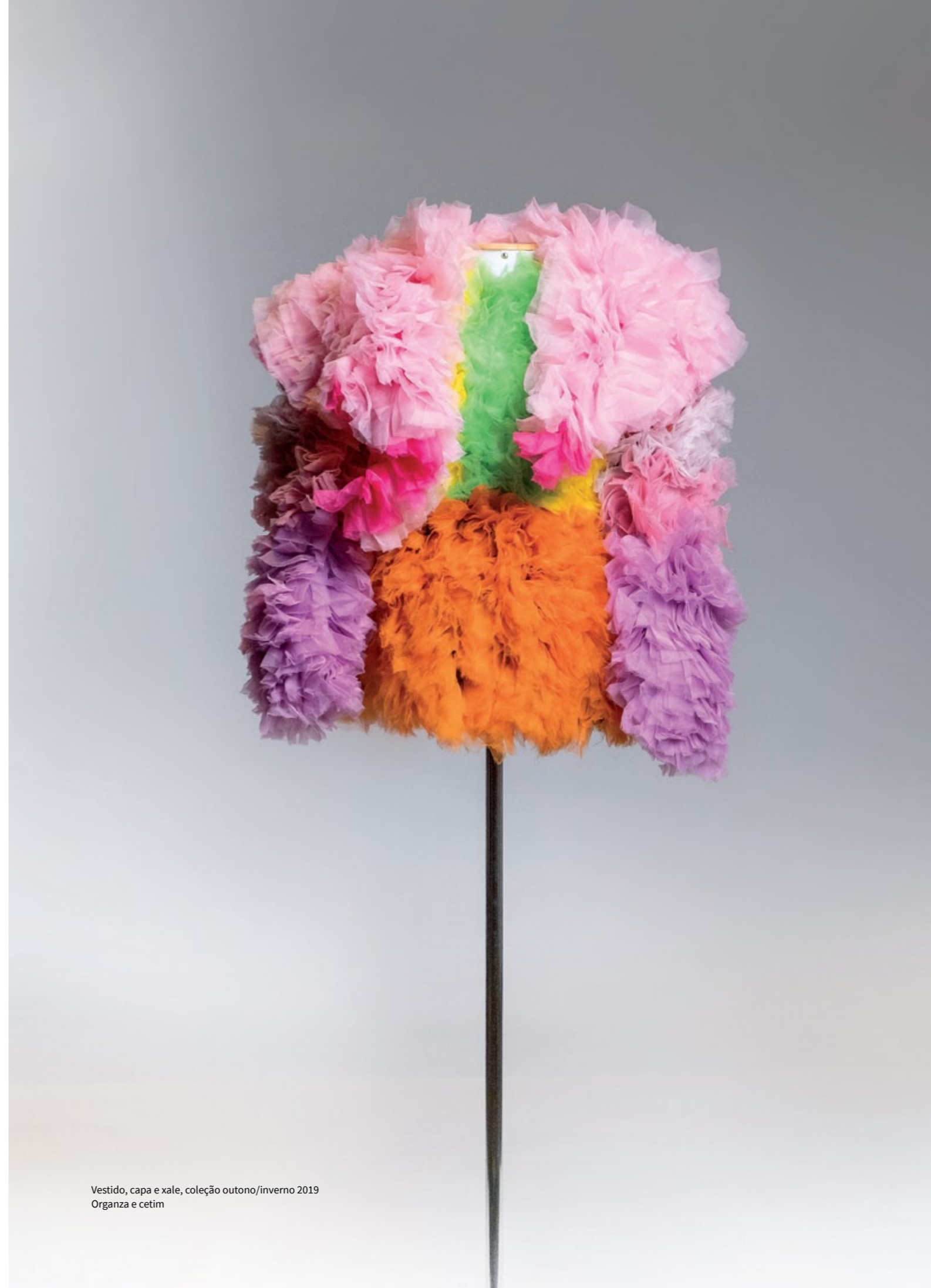
Vestido, capa e xale, coleção outono/inverno 2019 Organza e cetim